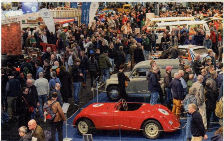
Bremen Classic Motorshow in der Messe Bremen, 31. Januar bis 2. Februar

Drei Tage, 52.000 Quadratmeter Ausstellungsfläche, staunen, fachsimpeln, handeln, Gleichgesinnte treffen – das ist die Bremen Classic Motorshow! Hier kommen Nachwuchs-Liebhaber wie „alte Hasen“ der Oldtimer-Szene gleichermaßen auf ihre Kosten. Im Fokus stehen historische Autos aus Japan, darunter Modelle wie ein Toyota 2000GT oder auch der Honda NSX. In Sachen Motorrad dreht sich hingegen alles um Entwicklungen der 80er-Jahre. Eine Sonderschau zeigt 24 Modelle, alles Bestseller und Meilensteine ihrer Zeit. Weitere Highlights: der Teilemarkt sowie erstmals eine Versteigerung historischer Werbemittel rund um Auto, Motorrad und Co.! www.classicmotorshow.de